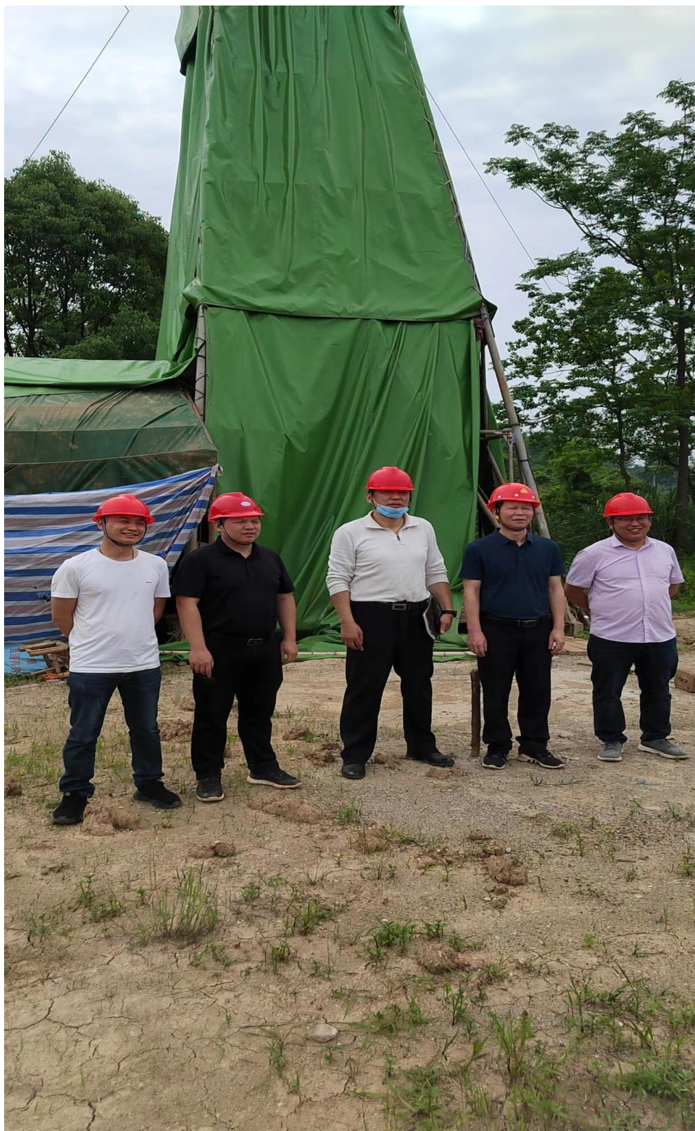
与江西有色地质矿产勘查开发院安全管理人员合影