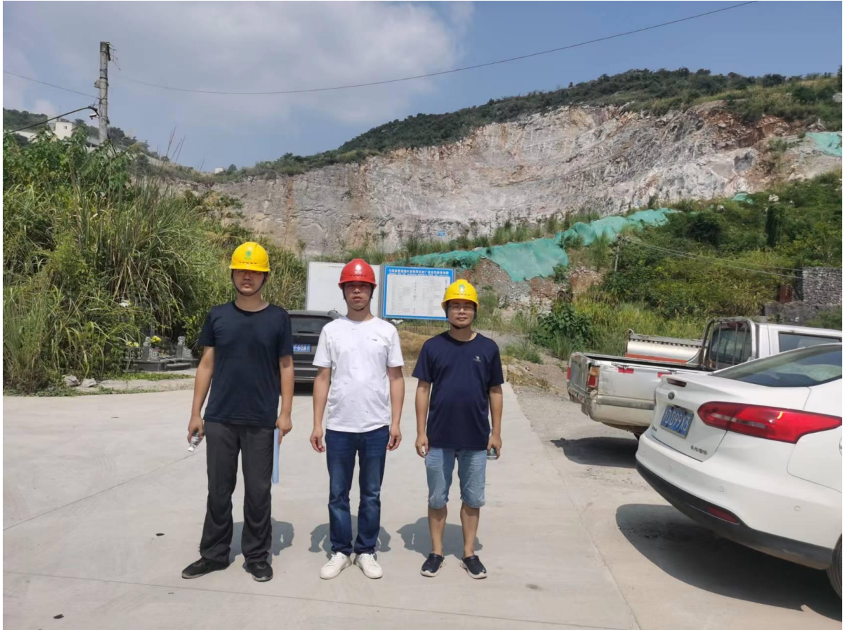
评价组成员与企业管理人员现场合影

及+100m 等 5 个台阶的边坡整治工程符合《整改设计》要求，具备竣工验收条件。剩余设计范围内的+100m~+56m 高陡边坡及辅助工程的整治企业应继续按《整改设计》设计要求，完成高陡边坡治理，确保边坡安全。