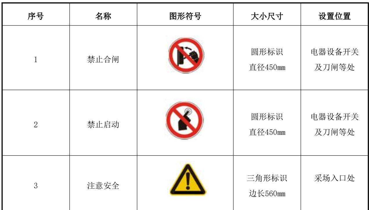
表 5-5 矿山安全标志一览表